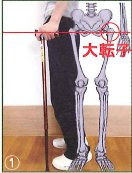
杖の持ち手が、大転子という骨の高さに合わせる。写真①

人それぞれ杖の高さは違いますが、杖の合わせ方があるって知ってました?? 今回は、簡単な杖の高さの合わせ方をご紹介します。