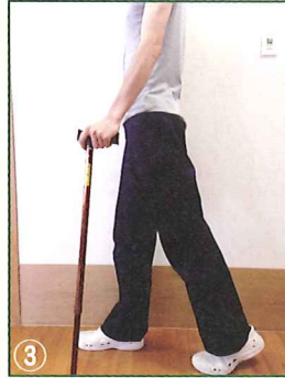
①か②で一度合わせてから、杖と足を一步踏み出した時に、肘が軽く曲がった状態で杖を付けるよう微調整する。写真③