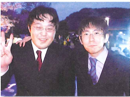
研修医1期生のツーショット