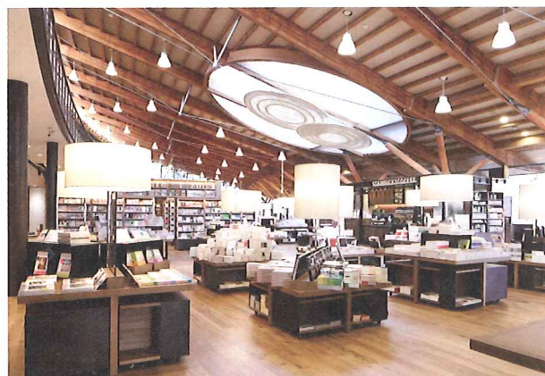
porto by nacasa & partners

ゆっくり本を読みながらコーヒーを飲んだり、学習室では高校生が勉強していたり、パソコンを持ってきて仕事をしている人がいるなど、多くの方々が利用しており武雄の新しい文化スポットになっているのかなと思いました。