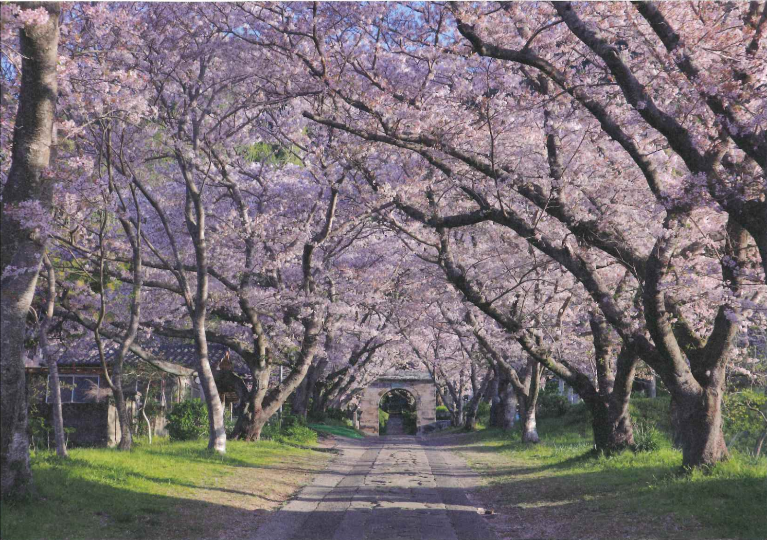
武雄市 『円応寺』 桜並木