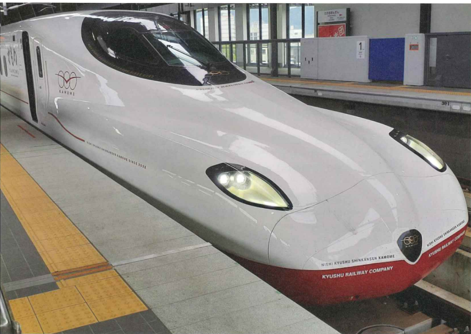
西九州新幹線「かもめ」開業（武雄温泉駅より）