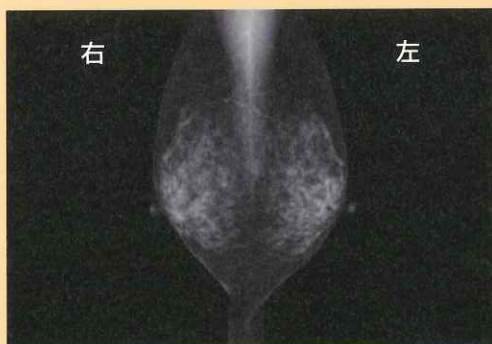
新しい機械で撮影した画像です。 左右対称に乳腺が出るように撮影しています。

より良い画像を撮影するために、少なからず痛みが生じるかと思いますが、新しい機械は、圧迫板が少ししなるような作りになっており、他にも患者様の肌が当たる部分は角を減らし、痛みが軽減できるように工夫されています。実際に以前より痛みが減ったと言われることが多くなりました。